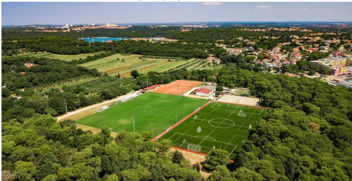
Slika 1. Nogometno igralište Premantika i Pomoćno nogometno igralište Premantika u Banjolama, na području Općine Medulin